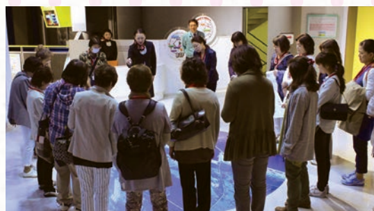
見学会での展示物を使った説明の様子

放射線や原子燃料サイクルの話は、専門的な言葉が多く「難しい」と思っていないでしょうか？私たちは、写真やイラストを取り入れた資料を中心に、分かりやすい説明を心掛けています。さらに、聞くだけではなく、実際に再処理工場に設置している機器の模型などを展示しているPRセンターで「目で見て」実感いただいたり、小さなお子様でも理解できるよう楽しみながら「触れて」学ぶゲームなどを用意しています。