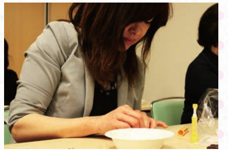
カルチャー講座付き勉強会の様子