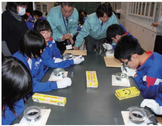
中学校での放射線出前授業の様子

福島第一原子力発電所の事故以降、放射線や当社の安全対策について「知りたい」という声が寄せられています。そこで私たちは、皆さまの疑問や不安の声にお応えするため、様々な勉強会などを行っており、2014年度は、青森県全体で延べ12,928人の方々にご参加いただきました。本号では、ひとりでも多くの方に興味を持っていただくために、当社の取組についてご紹介します。