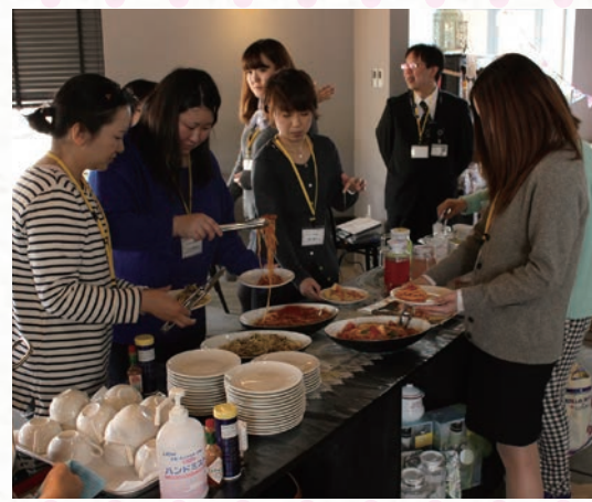
ランチ(バイキング形式)付き勉強会の様子

当社の勉強会やイベントのご案内をする「勉強会だけではつまらない」、「小さい子どもがいるから参加は難しい」といった声をいただきます。そこで、当社では、気軽に楽しめるブリザーブドフラワーなどのカルチャー講座を同時開催したり、美味しいと評判の地元レストランのランチをセットにした勉強会も企画しています。また、一部勉強会では小さなお子さまがいらっしゃる方のために、無料で利用できる託児サービスを準備するなど、気軽に参加できるように工夫をしています。