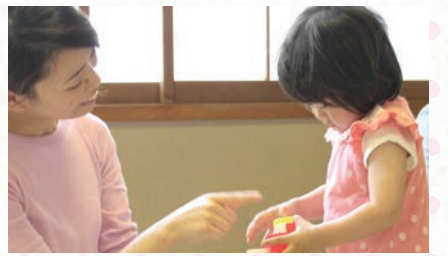
保育士による無料託児の様子