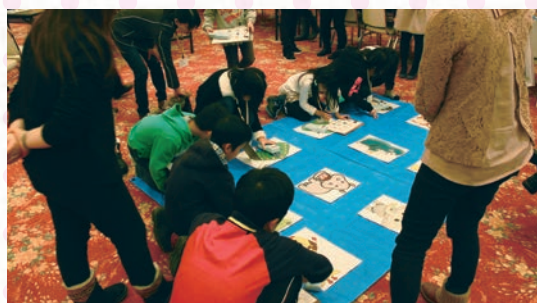
お子様と一緒に学べる親子勉強会の様子