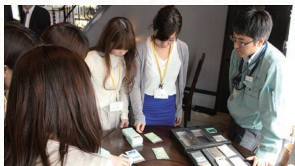
社員と一緒に、身のまわりの放射線の測定

勉強会では、聞きたいことがあっても質問しづらいにしている方を目にします。そこで、一部の勉強会では、参加者の方の近くに私たち社員が同席し、気兼ねなく話せるような雰囲気作りにも努めています。参加者の方からは「社員の方とも楽しくお話することができ、質問もしやすく分かりやすかったです。」といった声をいただいています。